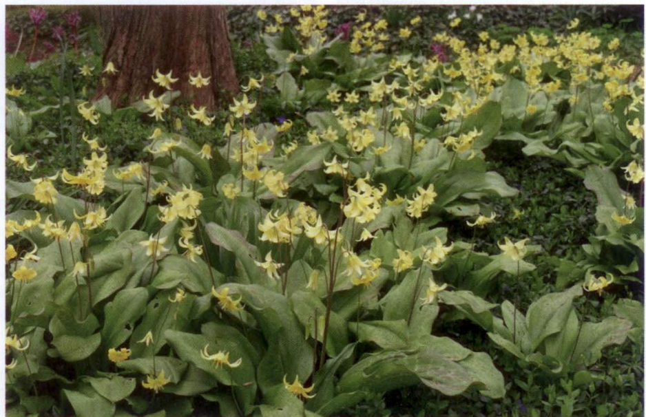
De verwilderding maakt Erythronium 'Pagoda' heel geschikt voor de moderne tuinder